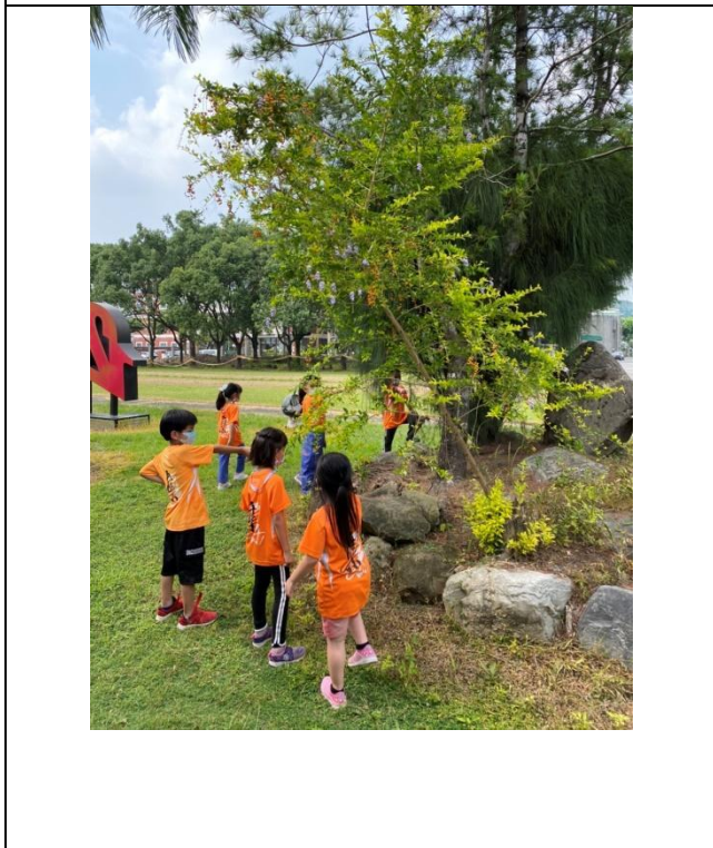
照片說明:戶外觀察及資料收集