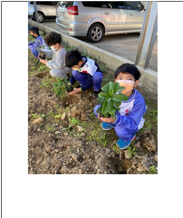
照片說明:配合本學期核心素養與學校活動 ---植樹節種樹