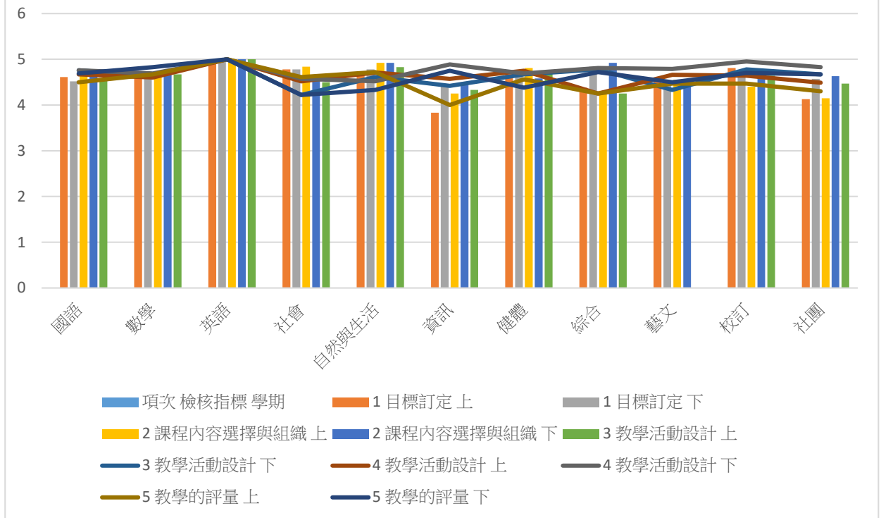
集集國小110學年校本課程評鑑分析