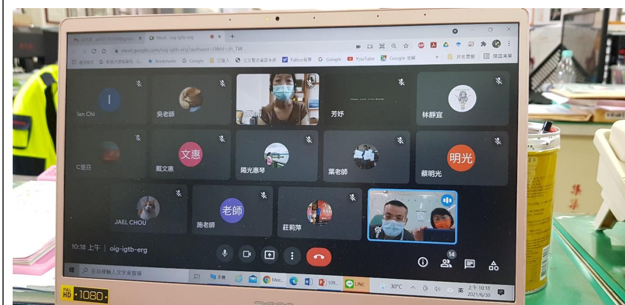
主任說明 109 學年課網課程評鑑方式